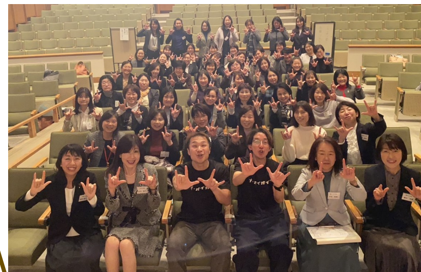
奈良県公立小中学校女性校長・教頭会冬季研修会