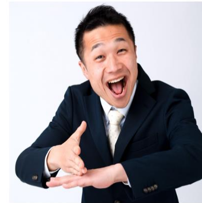
りゅうじ (きこえる)