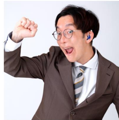
りよーじ (きこえない)