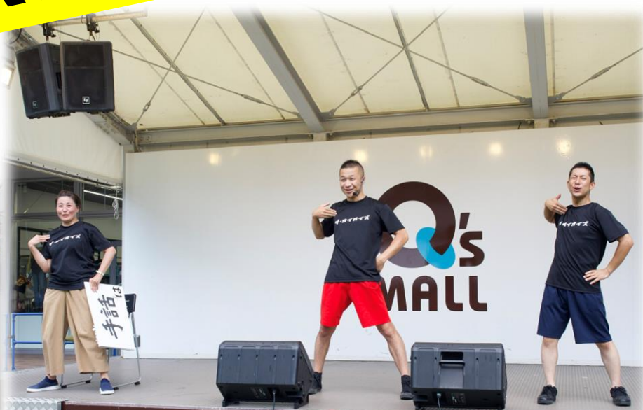
8月27日(土) ユニバーサルパークvol.4 森ノ宮キューズモールBASE (大阪)