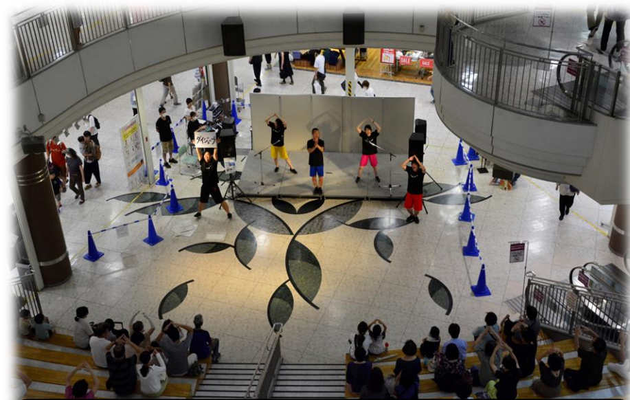
8月11日(土) 夏のエンタメショー イオン高槻 (大阪)