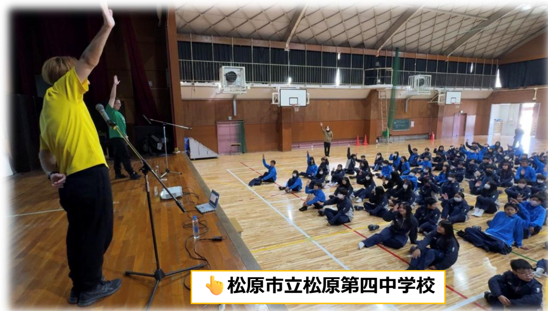
👉 松原市立松原第四中学校